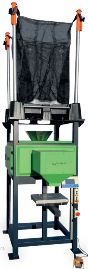
Sans systèmes de Big Bags Vario