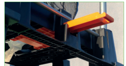
Plate-forme de réception du système de bigbags Vario