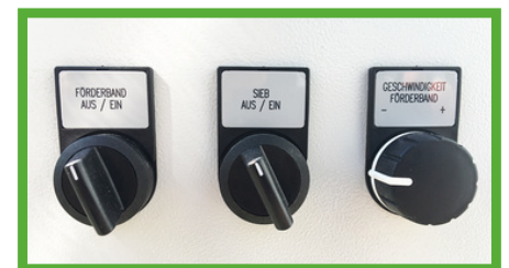
Hochwertige Steuerung inkl. Frequenzumrichter