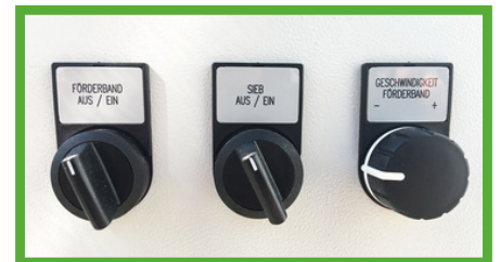
Gestion de haut niveau qui comprend les convertisseurs de fréquence.