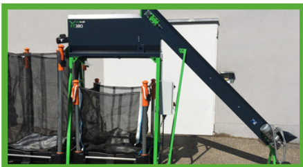
Ossature de construction stable et qualitativement de haut niveau.

Les granulés dépoussiérés sont la marque d'un standard qualité très élevé. Grâce à son tamis innovant ECOKRAFT, les granulés vont être d'abord transportés avec soin sur une bande convoyeuse et ainsi être refroidis naturellement. C'est pendant le tamisage que ce que l'on appelle les bris de pellets (poussière et granulés trop courts) vont être évacués. Ce procédé augmente considérablement la valeur des granulés lors de leur revente.